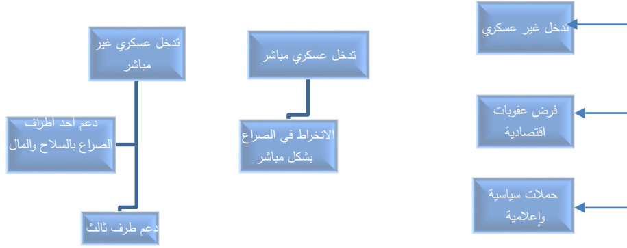
الشكل رقم (2) يوضح آليات التدخل الخارجي المختلفة