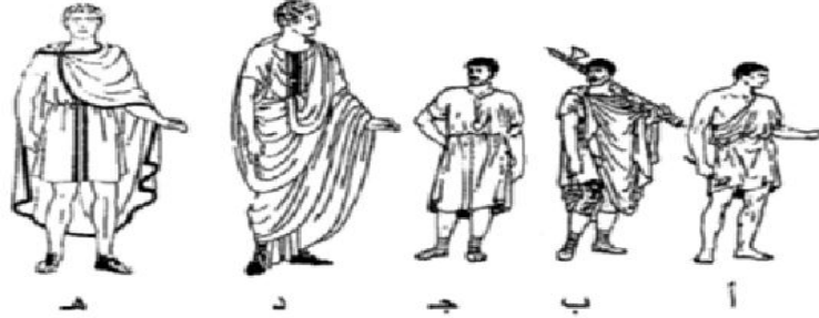
شكل رقم (7) أزياء رجالية متنوعة في الركبة وثوب كامل الطول

نقلا عن : سلوى جرجس ، طراز الأزياء في العصور القديمة، ص74