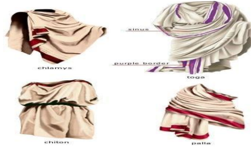
شكل رقم (2) أنواع من الملابس الرومانية