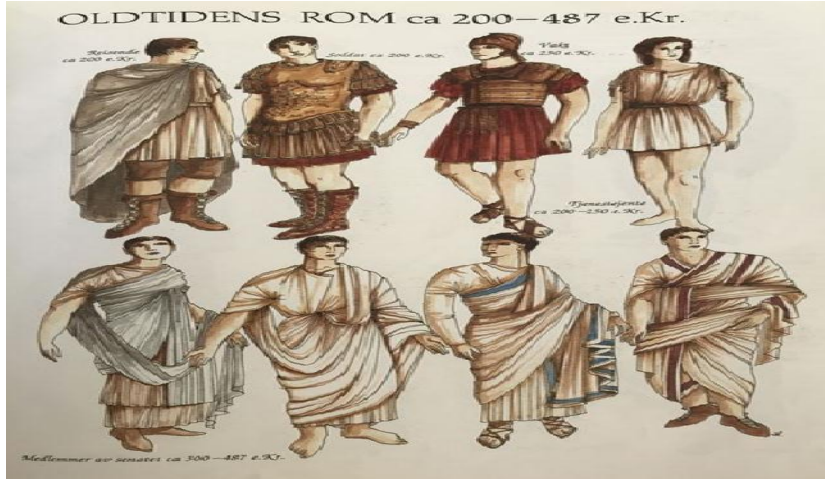
شكل رقم (3) عينة من الازياء التي يرتديها القادة والحكام وأعضاء مجلس الشيوخ الروماني

نقلا عن : ALEXANDRA CAOOM , CLTHING AND FASHION, p. 43