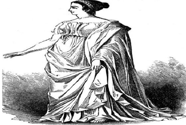
شكل رقم (5) الزي البالا الذي ترتدي النساء

نقلا عن: Faraj , O.,M., Abd Al Rahman, La Tomba Presso La Scuola Elementary,p147