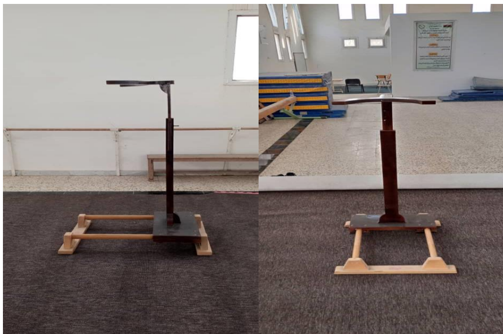
الشکل (1) (2) مواصفات الجهاز التعليمي المبتکر (المساعد)