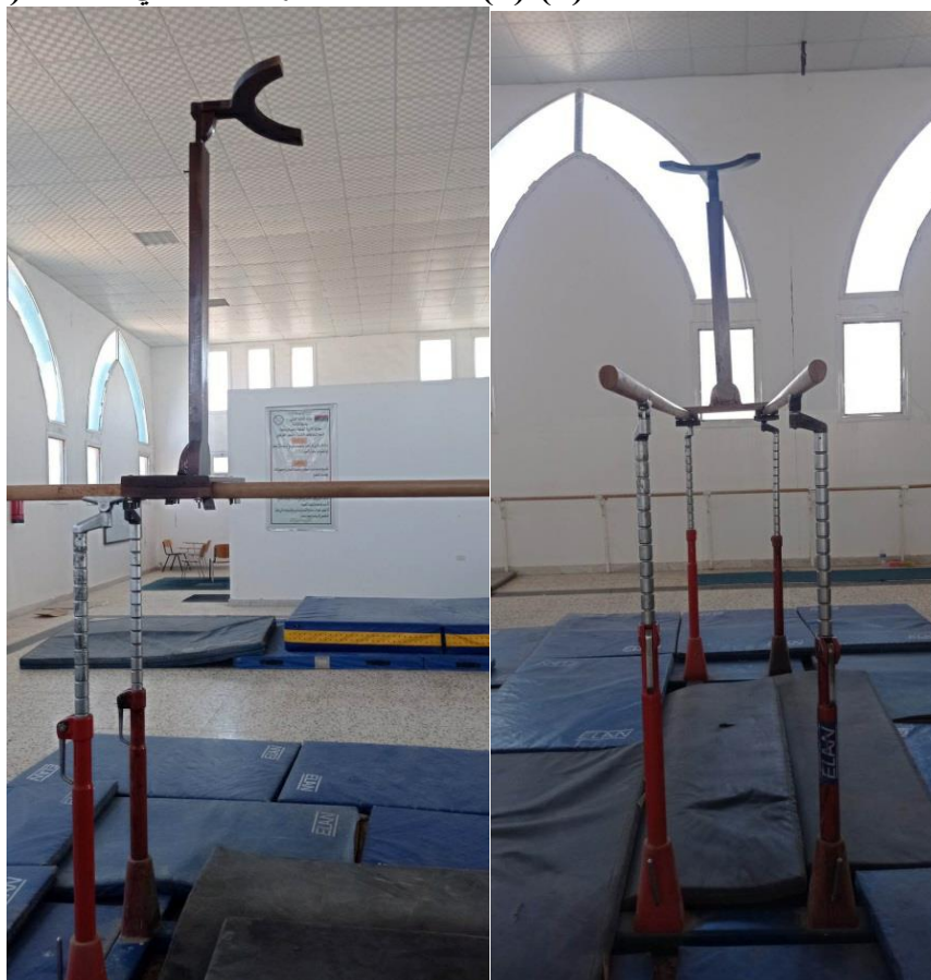
الشکل (3) (4) مواصفات الجهاز التعليمي المبتکر (المساعد)